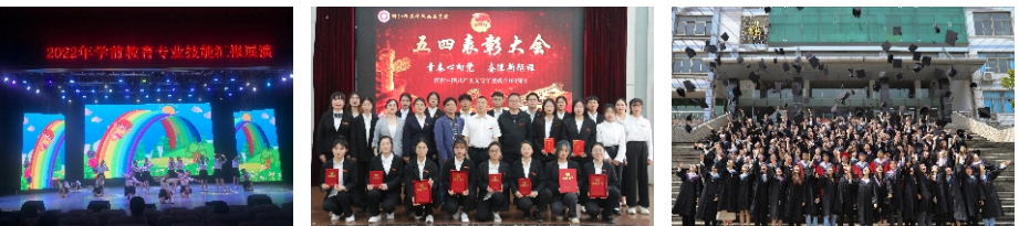
学前教育专业技能汇报展演 “青春心向党，奋进新征程”五四表彰大会 2022届部分毕业生合影

7. 丰富多彩的校园生活，为学生提供多方面素质拓展平台。学院现有30余个学生社团组织，各社团立足于兴趣与特长、结合各自的专业，常年开展丰富多样的校园文化活动，展现了多姿多彩的大学生活。