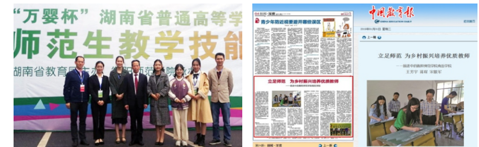
“万婴杯”湖南省第五届师范生教学技能竞赛参赛选手与学院领导合影 [中国教育报]立足师范为乡村振兴培养优质教师

等奖、9个三等奖的好成绩，其中2017年参赛的5名选手全部获奖，包括1个一等奖、3个二等奖、1个三等奖。