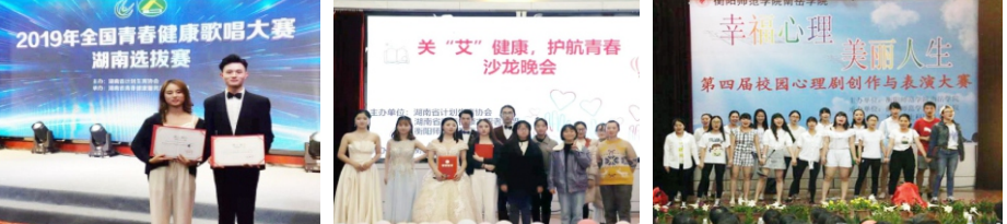
全国青春健康歌唱大赛湖南赛区折金夺银 关“艾”健康、护航青春沙龙晚会 第四届校园心理剧创作与表演大赛

8. 独树一帜的青春健康教育。为加强对大学生的青春健康教育，南岳学院于2017年专门成立了青春健康同伴社，该社在中国计生协以及省、市、区计生协的指导下，以大学生青春健康教育为核心，突出宣传导向，注重专业知识讲座，强化社区宣教活动，积极参加各类主题竞赛，取得了显著成绩。2019、2020、2021连续三年获得中国计生协青春健康高校项目；2017年组织同伴社社员参加全国大学生青春健康教育演讲比赛获湖南赛区一等奖，2018年获全国大学生青春健康教育舞台剧比赛湖南赛区二等奖第一名，2019年获全国大学生青春健康教育歌唱比赛湖南省赛区一等奖一项、二等奖两项。