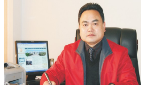
首批社科“百人工程”学者皮修平教授