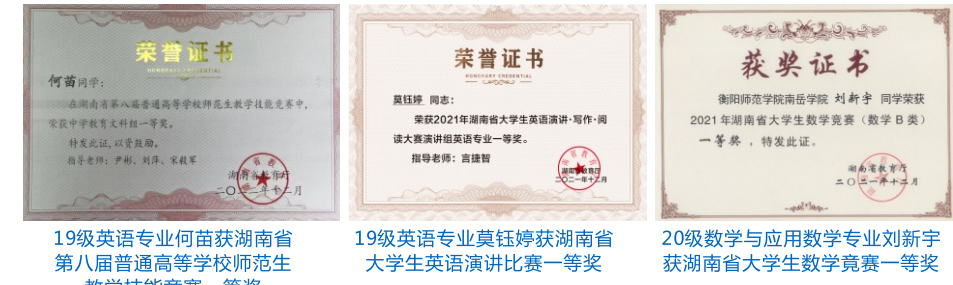
19级英语专业何苗获湖南省第八届普通高等学校师范生教学技能竞赛一等奖 19级英语专业聂钰婷获湖南省大学生英语演讲比赛一等奖 20级数学与应用数学专业刘新宇获湖南省大学生数学竞赛一等奖

5. 推行一系一赛，打造精品教学竞赛活动。学院每年举行院级竞赛20余项，鼓励、支持学生参加省级以上的竞赛活动。在近两年的国家、省级学科竞赛中，我院学生获得奖项78项，其中：国家级特等奖1项、一等奖3项、二等奖8项、三等奖10项、优秀组织奖1项；省级一等奖7项、二等奖14项、三等奖34项。